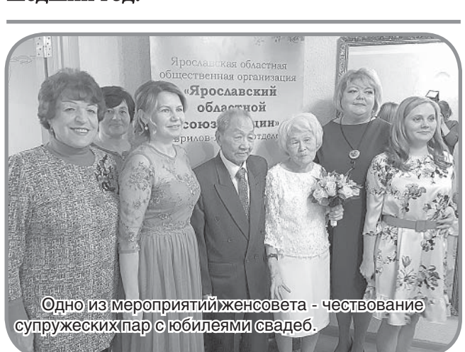
Одно из мероприятий женсовета - чествование супружеских пар с юбилеями свадеб.

рисунка, которые прошли под эгидой Ярославского областного союза женщин и при непосредственном участии районного отделения. Один из конкурсов был посвящен борьбе с серьезным заболеванием – остеопорозом. Он назывался «Береги кости смолоду». Второй конкурс – «Путешествие в мир театра народов «России» - был посвящен Году театра в России. Юные гаврилов-ямцы во всех творческих состязаниях проявили себя достаточно активно, достойно представили свои работы и получили несколько призовых мест.