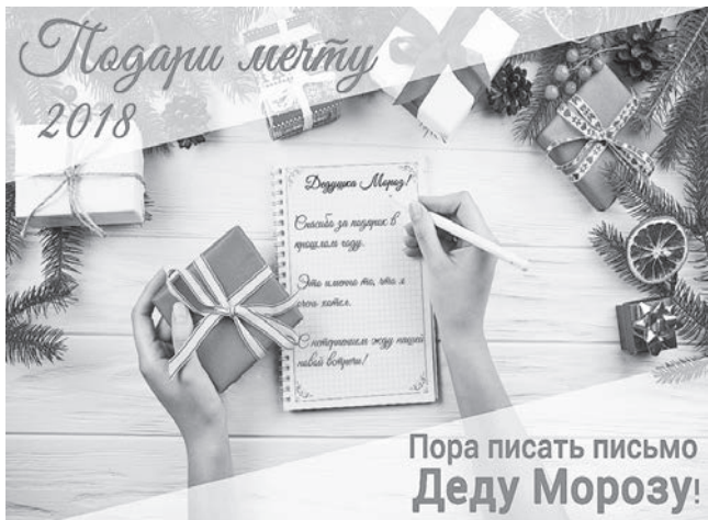
Пора писать письмо Деду Морозу!

Не за горами самые волшебные и добрые праздники - Новый год и Рождество, от которых мы, а особенно дети, все ждем какого-то чуда. Но, к сожалению, не все родители могут подарить своим малышам эту сказку, зато это можем сделать мы с вами, присоединившись к благотворительной акции "Подари мечту", которую у нас в городе запускает МУ "Молодежный центр" совместно с представителем Ярославской областной организации инвалидов "Лицом к миру". Благодаря чему любой желающий может стать добрым волшебником и исполнить мечту особенного ребенка - не всегда мальчика, а даже того, кто перешагнул рубеж 18 лет. У нас такая акция пройдет впервые, хотя в Ярославле она пользуется успехом уже не первый год. А значит теперь, благодаря нашей помощи, обязательно исполнятся мечты и нескольких юных гаврилов-ямцев, страдающих тем или иным недугом.