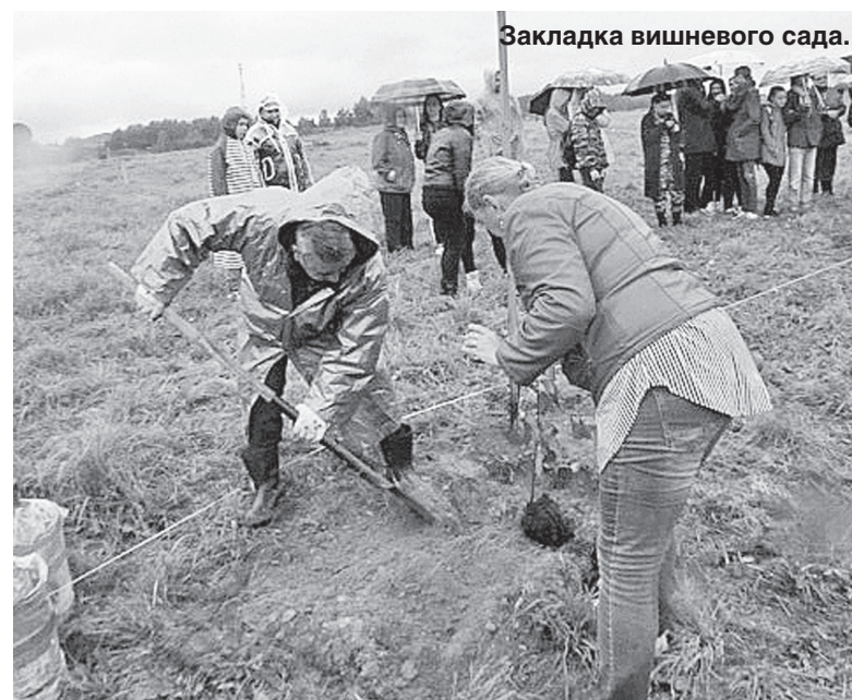
Закладка вишневого сада.