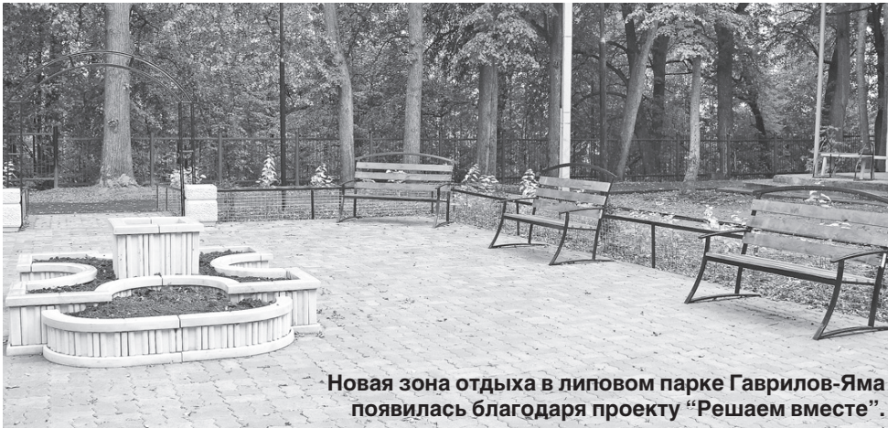
Новая зона отдыха в липовом парке Гаврилов-Яма появилась благодаря проекту "Решаем вместе".

Министерство финансов России представило доклад "О лучшей практике развития инициативного бюджетирования в субъектах Российской Федерации и муниципальных образованиях" за 2017 год. Ярославская область с проектом "Решаем вместе!" названа лидером по объемам финансирования данного направления из регионального бюджета.