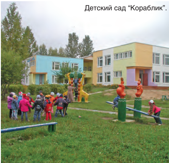
Детский сад "Кораблик".