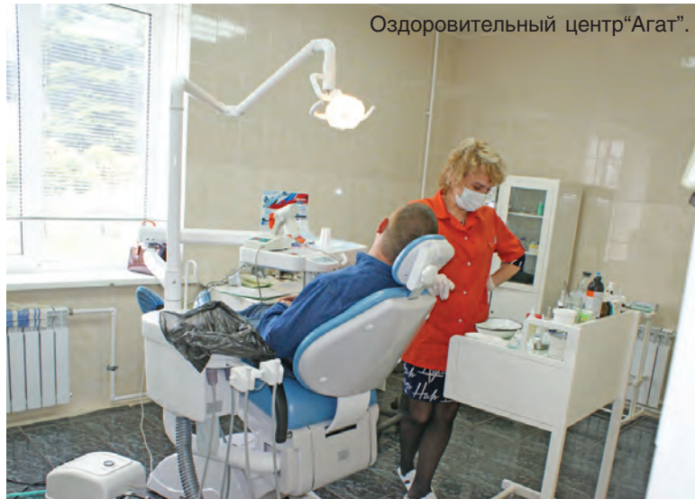
Оздоровительный центр "Агат".