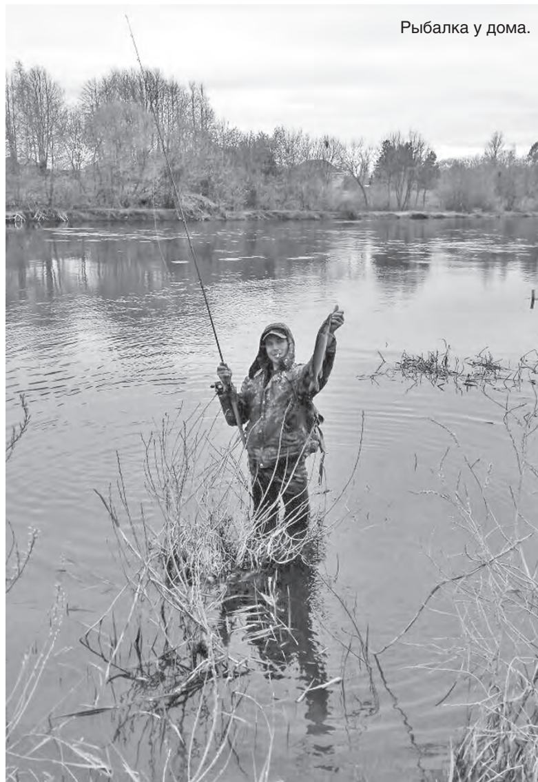
Рыбалка у дома.

- Если говорить про экономию, то я отчасти спасаюсь тем, что некоторое из рыбацкого снаряжения научился мастерить сам, например, делаю мормышки, без которых на рыбалке никак, блесны зимние и разные приманки, на которые ловлю не хуже чем на магазинные. Ловить на свое - совсем другое удовольствие, нежели на магазинное. Особенно когда у меня клюет, а у других - нет. В ручную работу вкладываю много сил. Вообще, считаю, что для профессионалов уметь изготавливать