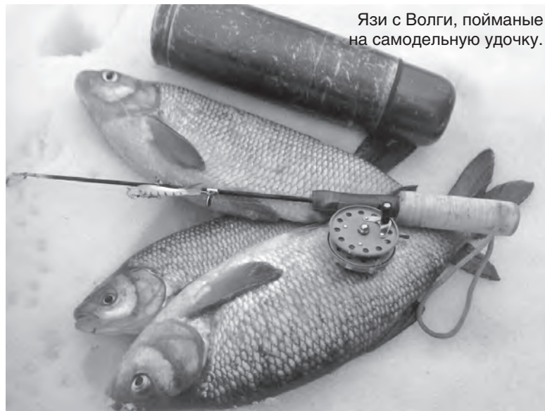
Язи с Волги, пойманные на самодельную удочку.

Бесполезно провозившись у лунки еще какое-то время, мы с товарищем начали звать подмогу. Подоспевший на наши крики дедуля-рыбак помог продолжить лунку, и я достал своего первого щукаря едва ли не с меня ростом. Кстати, именно после этого улова другие рыбаки начали воспринимать меня уважительнее. Да и сама я, если честно, как-то серьезнее начал смотреть на свое увлечение. К слову, до сих пор я не поймал рыбу больше той. Бывают и по восемь, и по девять килограммов, но чтобы десять - ни разу. К тому же, сейчас на рыбалке уже не обой-