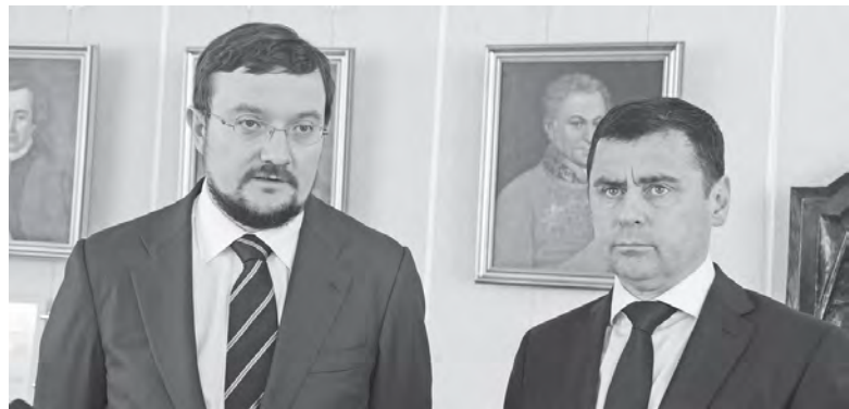
зал Дмитрий Миронов.

- В Ярославле очень активно работают гражданские активисты по вопросам ремонта и содержания дорог. Мы с ними и в прошлом году продуктивно поработали, и в этом рассчитываем на конструктивное взаимодействие. Нам важно направить выделенные средства на самые проблемные участки, которые приносят больше всего неудобств жителям, - ска-