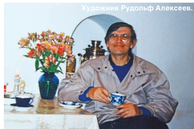
Художник Рудольф Алексеев.

И хотя символический момент дарения уже, можно сказать, состоялся, коллекция картин Рудольфа Алексеева переедет на его малую родину лишь после соблюдения всех организационных формальностей. И новая экспозиция будет официально открыта при самом большом стечении жителей города, для которых, в конечном итоге, и творил художник.