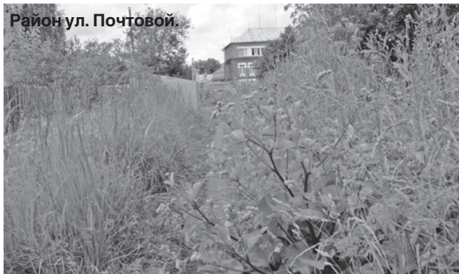
Район ул. Почтовой.