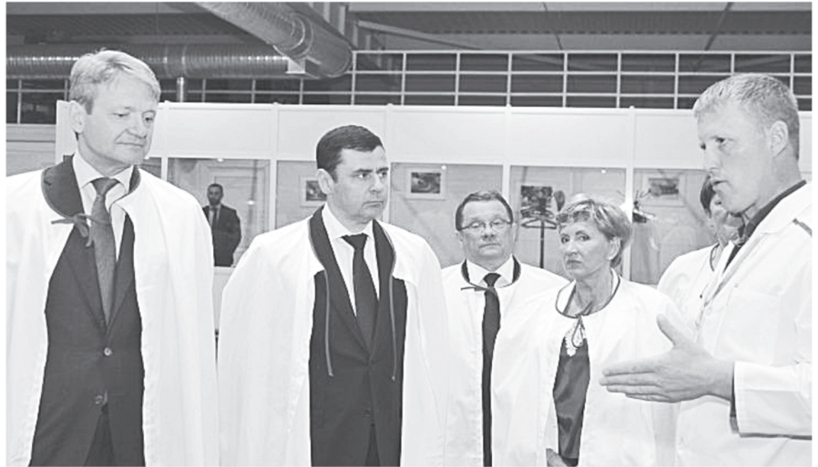
Рабочая поездка на птицефабрику «Волжанин»

Оживлённую дискуссию на Губернаторском совете вызвала тема фермерства. Помимо увеличения размера грантов начинающим фермерам, правительство области активно помогает