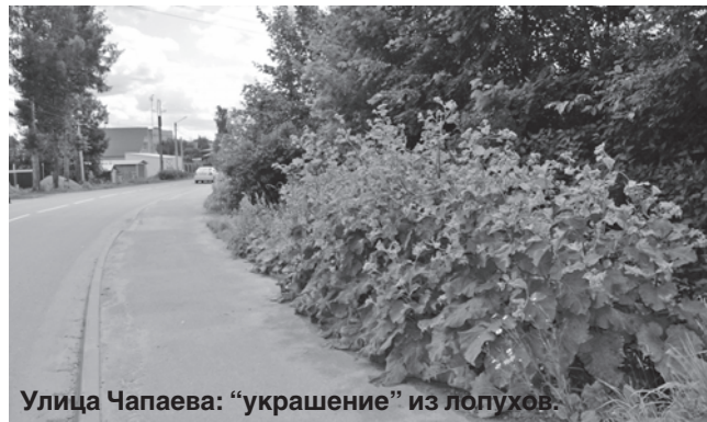
Улица Чапаева: "украшение" из лопухов.