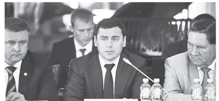
На заседании Совета при полномочном представителе президента в ЦФО

Правительство области сегодня серьёзно переформирует туристическую отрасль. В соавторстве с экспертным сообществом разработана стратегия развития отрасли. Речь идёт о формировании полноценной туристической отрасли, которая приносит доходы в бюджет, стимулирует развитие сопутствующего малого бизнеса, обеспечивает занятость населения, даже активизирует внешнеторговый оборот. Кстати,