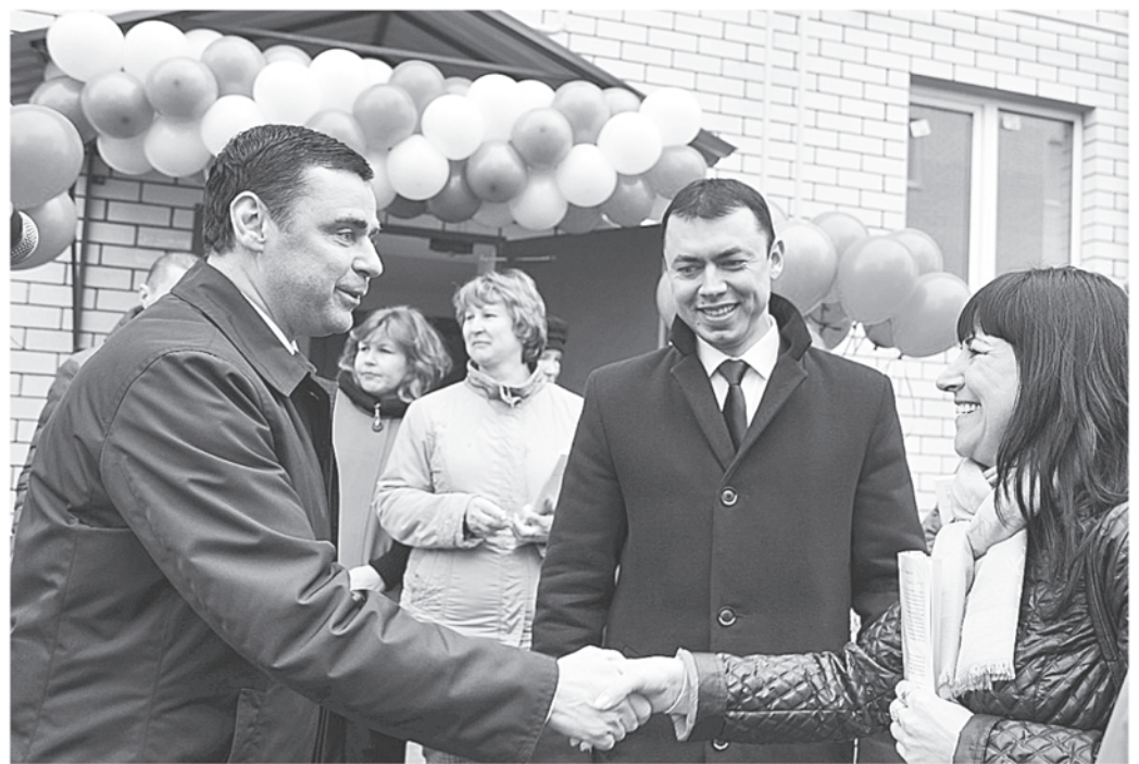
Вручение ключей в Тутаеве

Целенаправленная политика областной власти даёт результаты. В конце 2016 – начале 2017 года введены в эксплуатацию четыре долгостроя. 645 ярославцев получили долгожданное жильё. Ещё пять проблемных домов пла-