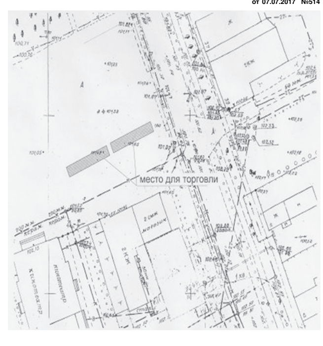
АДМИНИСТРАЦИЯ ГОРОДСКОГО ПОСЕЛЕНИЯ ГАВРИЛОВ-ЯМ