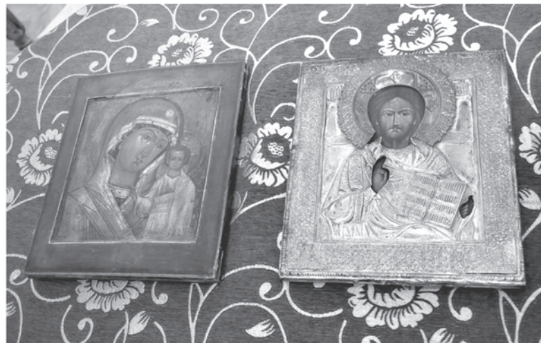
Казанская икона Божией Матери и икона «Господь Вседержитель».

Казанская икона Божией Матери середины XIX века и икона «Господь Вседержитель» конца XIX века органично дополнили воссозданный класс земского училища, открытый в Карабихе в 1894 году. Одним из обязательных предметов в земском училище был Закон Божий и Священная история, поэтому в классе, в «красном углу» в разные годы находились эти образа.