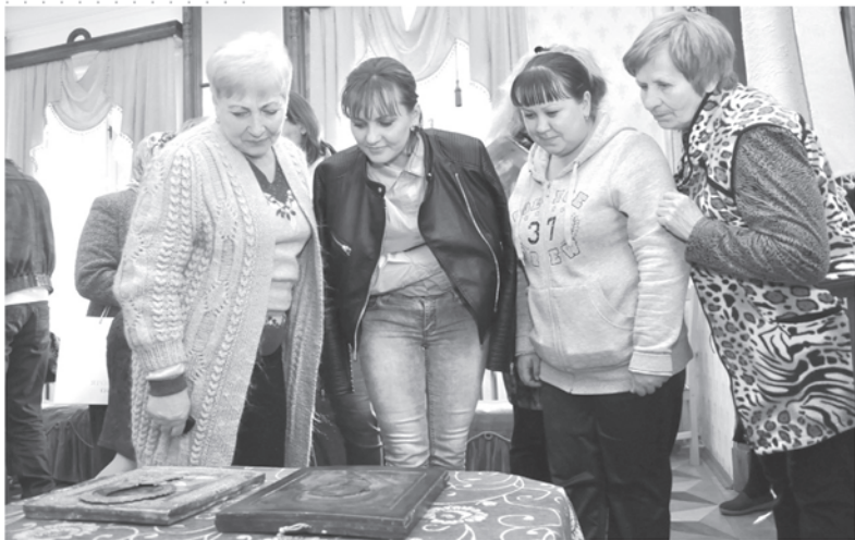
Старинные иконы в музее-заповеднике «Карабиха».

ПРАВОСЛАВНЫЕ СВЯТЫНИ 19 ВЕКА ДОПОЛНИЛИ ЭКСПОЗИЦИЮ В МУЗЕЕ-ЗАПОВЕДНИКЕ КАРАБИХА