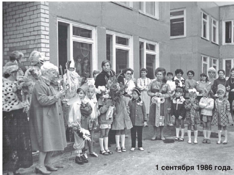
1 сентября 1986 года.

1 сентября 1986 года свои двери для самых маленьких гаврилов-ямцев распахнул детский сад "Кораблик". По тогдашним меркам это было просто уникальное дошкольное учреждение и неудивительно, ведь проект будущего садика руководство завода "Агат" привезло аж с ВДНХ, где проходила специализированная выставка. Новый садик не только мог вместить 200 с лишним малышей, но и имел собственный бассейн, чем не могли похвастаться садики даже в крупных городах. Все это сразу вывело "Кораблик" в число лучших дошкольных учреждений Гаврилов-Яма, куда стремились отдать своих детей многие папы и мамы. С тех пор прошло 30 лет, но садик с гордым именем "Кораблик" по-прежнему сохраняет лидирующие позиции в дошкольном образовании, имея в своем педагогическом арсенале совершенно уникальные изюминки, каких нет больше ни у кого: зимний сад, театр, библиотеку и музей.