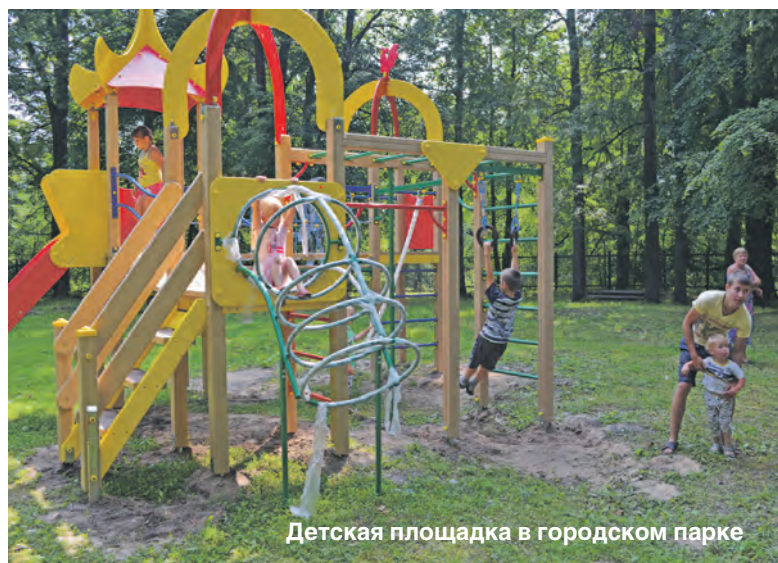
Детская площадка в городском парке