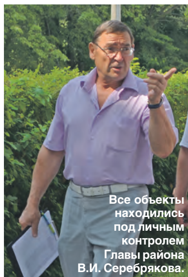
Все объекты находились под личным контролем Главы района В.И. Серебрякова.