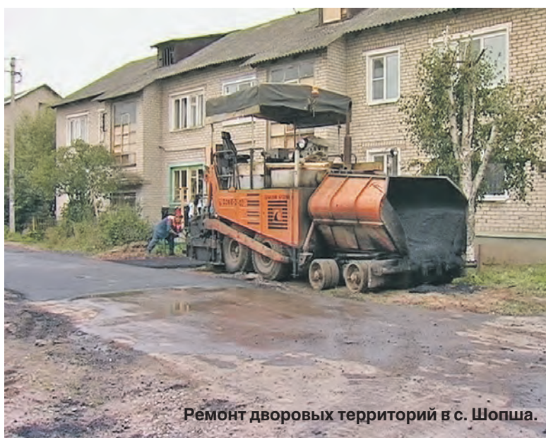
Ремонт дворовых территорий в с. Шопша.

ком решили сделать упор на комплексное благоустройство мест массового отдыха. Во-первых, привести в порядок уникальный липовый парк, который почти 150 лет назад посадили сами местные жители, и который долгие годы оставался одним из самых любимых мест отдыха великоселов. Здесь провели работы по расчистке парка от лишней поросли, отбраковку и вырубку старых деревьев, и устройство подстилающих слоев под