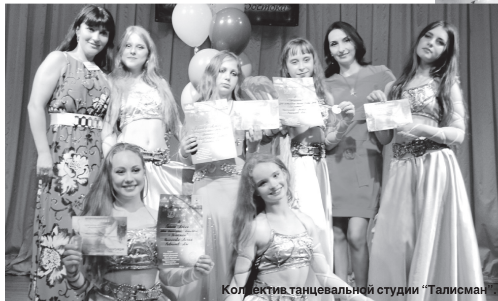
Коллектив танцевальной студии "Талисман".

риятии. Организаторы устроили для участников великолепный мастер-класс "Межансе с вуалью" Марины Шишковой - обладатель-