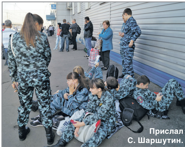
Прислал С. Шаршутин.

Ожидание на вокзале. Поездка на Бородинское поле.