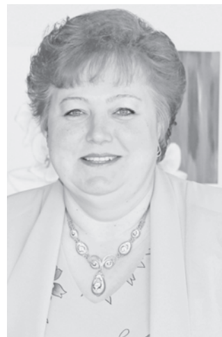
В каждом дне находить вдохновение И тепло в своем сердце беречь! Коллектив УПФР в Гаврилов-Ямском муниципальном районе.

Пусть минуты все будут счастливыми, Нежных слов и улыбок полны, Жизнь эмоции дарит красивые, И пленит аромат новизны! Комплиментов, цветов, восхищения, Исполненья мечты, новых встреч,