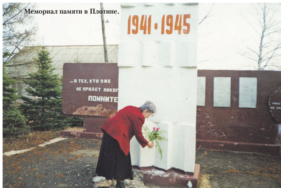
Мемориал памяти в Плотине.

Письма с фронта! Получить мы их не успели... Убили деда сразу - в первом же бою. Слова казенные вдову не обогрели И не спасли от голода семью. Вдова завывала безутешно, громко, тонко, Упала в пыль, закрыв беспомощно глаза. В руке зажата роковая похоронка, Качнулись в горе беспросветном небеса. Одна осталась? Что вы!