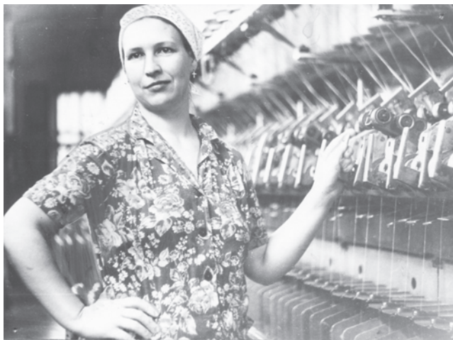
Лучшие труженики льнокомбината тоже были украшением города.

За лучшие эскизы, макеты, планы установлены премии: первая - 25 рублей, вторая - 15 рублей и третья - 10 рублей.