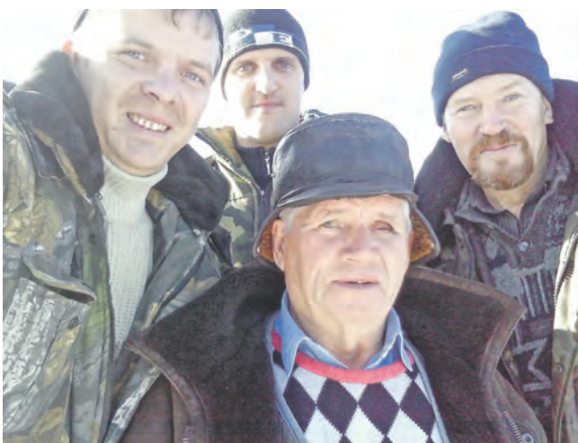
Фото прислал Владимир Пестов.

Только 1 день, 14 декабря, с 10 до 17 часов