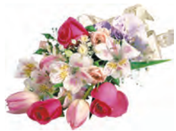
Дети и внуки.

Внуки выстроились в ряд Вас поздравить все хотят! Мы их чуть опередим, Добрых слов наговорим! При виде вас в лице светлея, Поздравляем с юбилеем! И в рубиновом сиянье Шлем свое в любви признание!