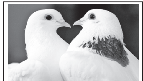
Пара голубей на свадьбу. Тел. 8-905-646-73-41.

5.15 "Тайны еды" (16+). 5.30, 7.00 "Джейми: обед за 30 минут" (16+). 6.30 "Удачное утро" (16+). 8.00 "Полезное утро" (16+). 8.30 Мультфильмы (0+). 8.35 X/ф "РОДНЯ" (16+). 10.30, 19.00 Т/с "ВЕЛИКОЛЕПНЫЙ ВЕК" (16+). 18.00 Т/с "ОНА НАПИСАЛА УБИЙСТВО" (16+). 18.55, 23.45 "Одна за всех" (16+). 22.40 "Битвы за наследство" (16+). 0.30 X/ф "МЫ ПОЖЕНИМСЯ. В КРАЙНЕМ СЛУЧАЕ, СОЗВОНИМЯ!" (16+). 2.10 X/ф "КЛЯТВЫ И ОБЕЩАНИЯ" (16+).