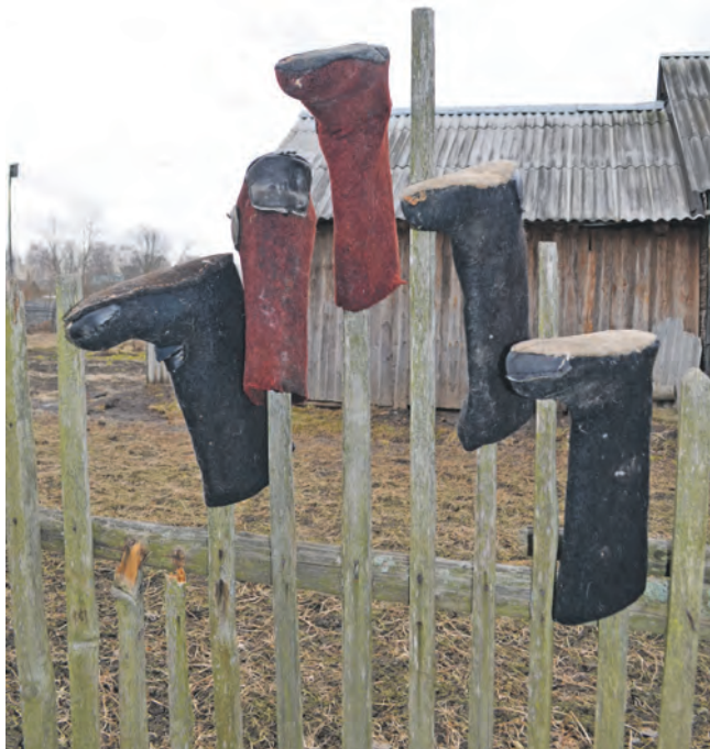
Валенки, валенки. На просушке стареньки!