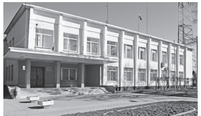
трудоустройства, которые успешно действуют в Гаврилов-Ямском районе уже не один год.

В администрации района состоялось совещание по летнему благоустройству, главными участниками которого стали директора городских школ. А необходимость обсуждения этого вопроса на столь высоком уровне была вызвана тем, что закон "Об образовании" теперь запрещает использовать бесплатный труд школьников на работах по городскому благоустройству без их согласия, а также без согласия их родителей. А ведь именно старшеклассники долгие годы были главной "движущей силой" по озеленению своих населенных пунктов. Польза была взаимной: и ребята без дела не сидели, и улицы благодаря их усилиям превращались в настоящие цветочные оазисы - клумбы получались одна краше другой. Как же быть в такой ситуации? Как наводить красоту и порядок в городе без участия такой внушительной "движущей силы"? Выход все же нашли. Бесплатно школьники больше трудиться не будут - их устроят на работу через Молодежный центр по одной из региональных программ летнего