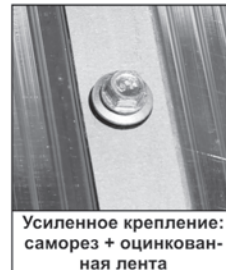
Усиленное крепление: саморез + оцинкованная лента

трубы, покрашенные грунт – эмалью, имеют склонность покрываться ржавчиной, теряя свой внешний вид и прочность, начиная попросту гнить.