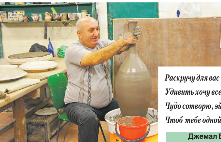
Раскручу для вас свой гончарный круг. Удивить хочу всех людей вокруг. Чудо сотворю, эй, красавица, Чтоб тебе одной лишь понравиться!