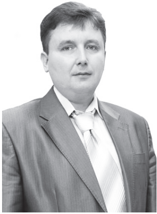
Кандидат в депутаты Ярославской областной Думы по округу № 24