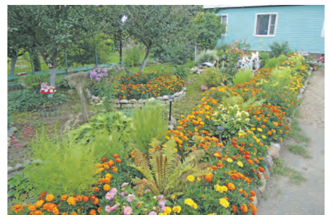
Фото Гульнары Шухратовны Камкиной, д. Прошеноно.