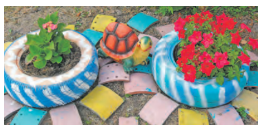
Сад и огород семьи Трещаловых.