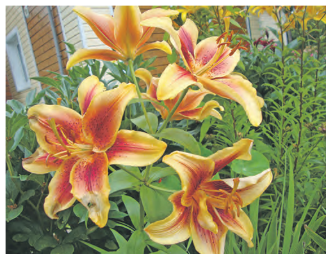
Фото Дубровиной Натальи Александровны (Гагарино).