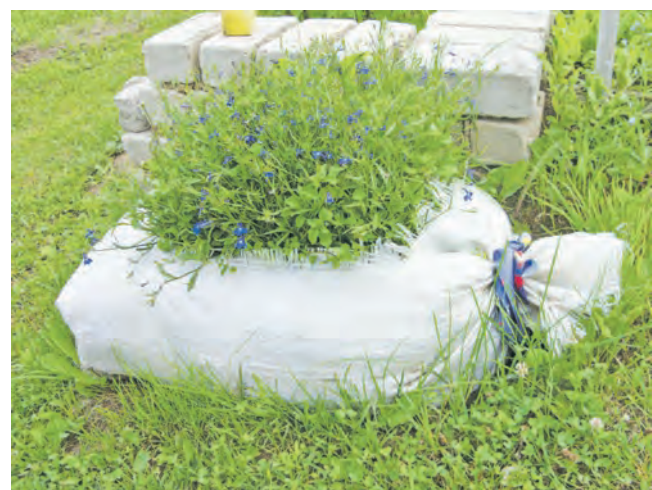
Фото Ирины Сергеевны Воскресенской.