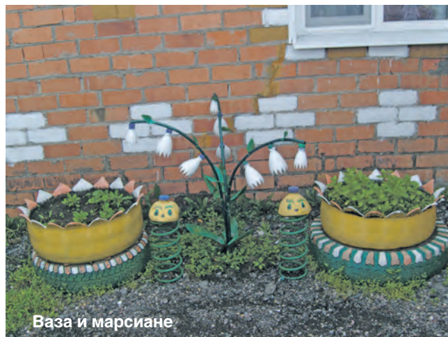
Ваза и марсиане