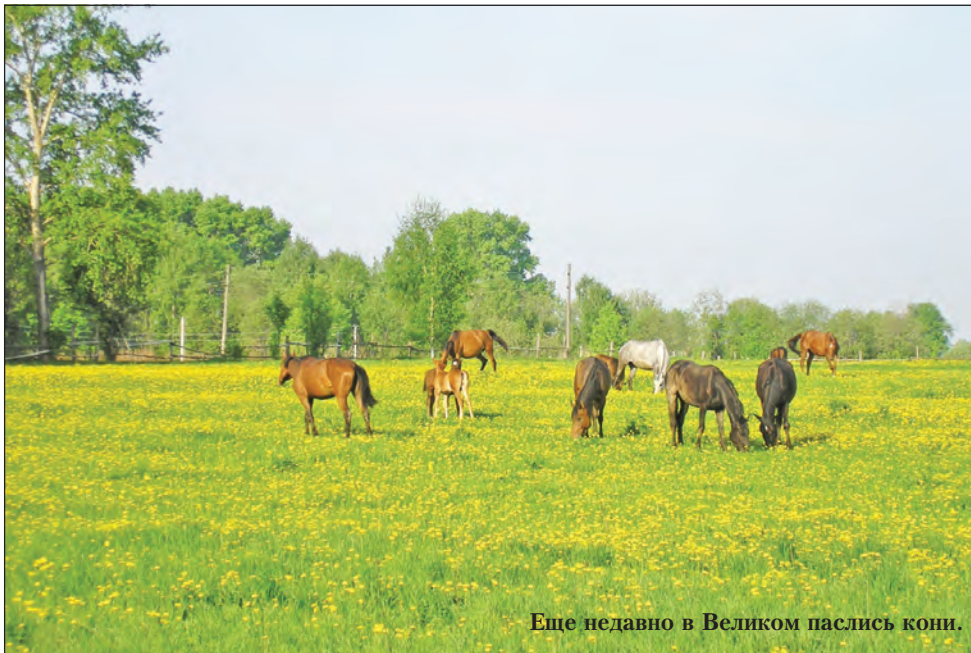
Еще недавно в Великом паслись кони.