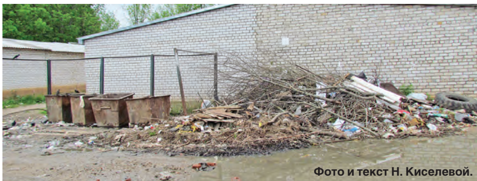
Фото и текст Н. Киселевой.

На этот вопрос и просим ответить городские власти.