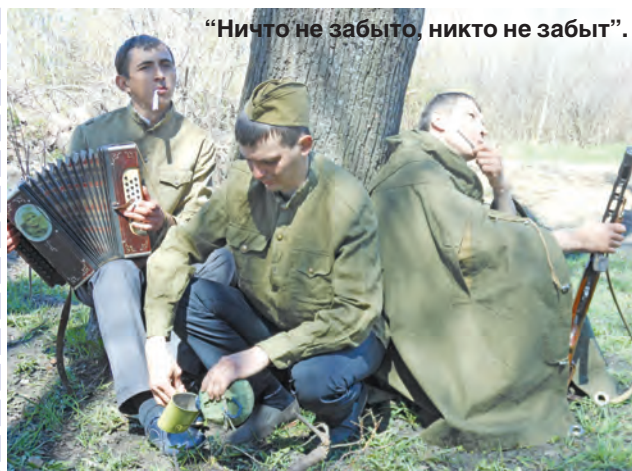
"Ничто не забыто, никто не забыт".

Победителями стали представители клуба фотолюбителей "Окно в мир". Второе место завоевала дворовая команда "Т-34". Замкнули тройку призеров "Боевые подруги" (Муниципальный молодежный совет). Отдельно - за лучший снимок - отмечена команда работающей молодежи "Ничто не забыто, никто не забыт". Специального приза от партнеров конкурса компании "Сизель парфюм" в рамках молодежного проекта Young generation удостоена команда "Улыбка" (учащиеся школы №1).