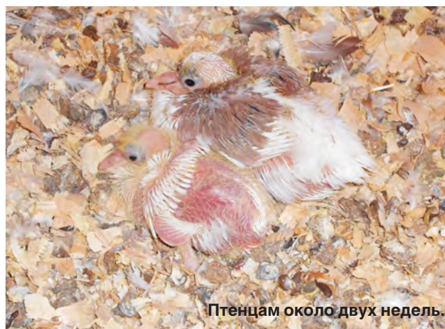
Птенцам около двух недель.