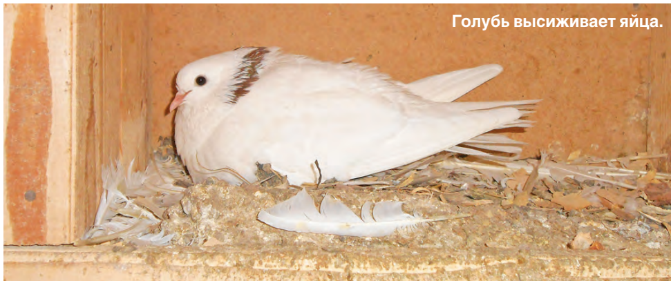
Голубь высидывает яйца.