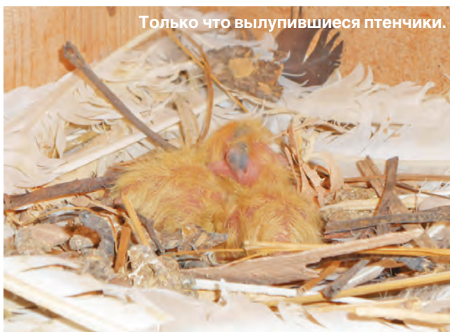
Только что вылупившиеся птенчики.