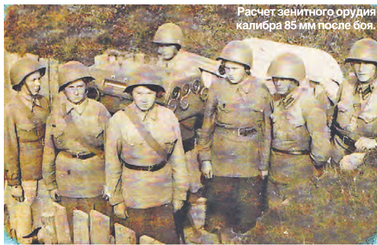
Расчет зенитного орудия калибра 85 мм после боя.

Коренные великоселы, особенно почтенного возраста, помнят, как в начале 1942 года в центре села вдруг "поселилась" целая группа солдат. Все они были исключительно молоды. Нежные лица, пряди волос из-под армейских шапок явно выдавали принадлежность к женскому полу. Еще больше удивились сельчане, когда двое девчат стали бойко подниматься на заброшенную соборную колокольню Великосельского кремля.