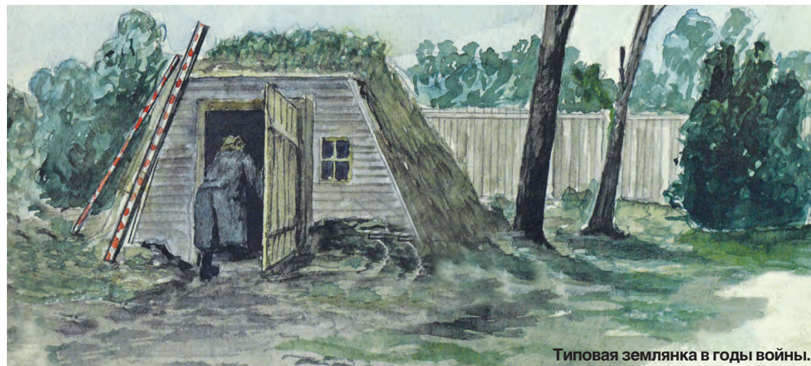
Типовая землянка в годы войны.

Семиуровневая, высотой 70 м, она и сейчас является одной из главных достопримечательностей старинного села. В 1942 году командирам батальона воздушного наблюдения, обнаружения и связи она приглянулась для организации хотя бы временного поста наблюдения за приближением к Ярославлю фашистских стервятников. Этого требовала обстановка, ведь на Ярославль еще в больших масштабах обрушивался смертоносный груз сотен фугасных и зажигательных бомб. Гибли люди, нарушались коммуникации, связь. Особенно большие разрушения были на шинном заводе (в годы войны - резино-асбестовый комбинат), ТЭЦ-1, в жилых кварталах.