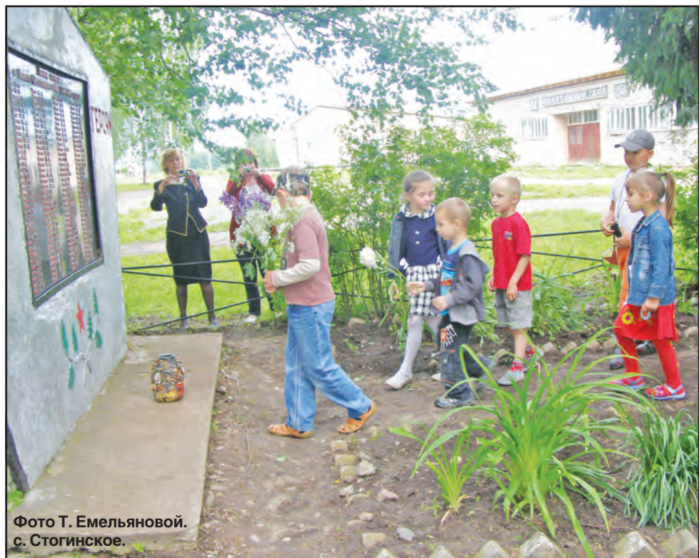
Фото Т. Емельяновой. с. Стогинское.