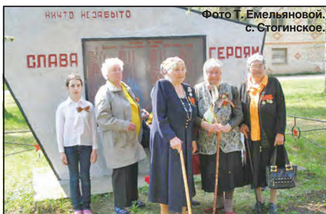
с. Стогинское.