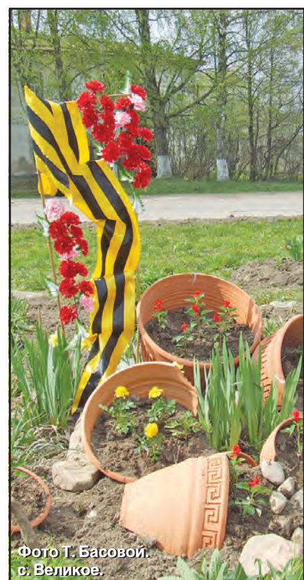
с. Великое.