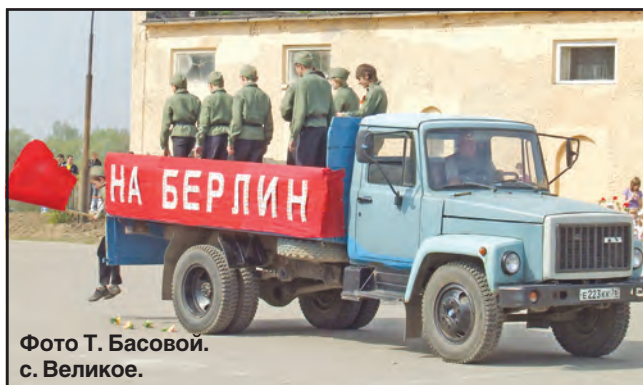
с. Великое.