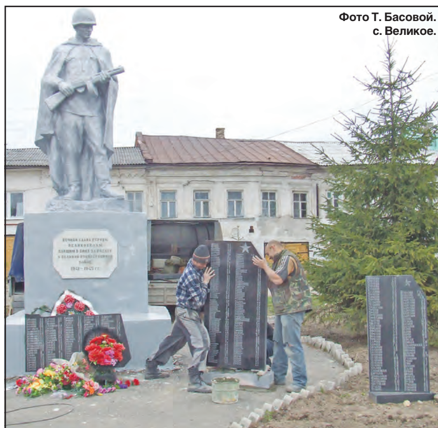
с. Великое.