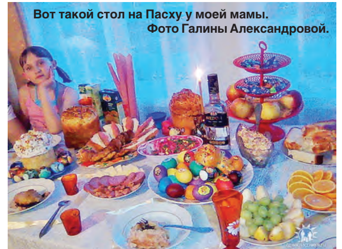
Вот такой стол на Пасху у моей мамы.