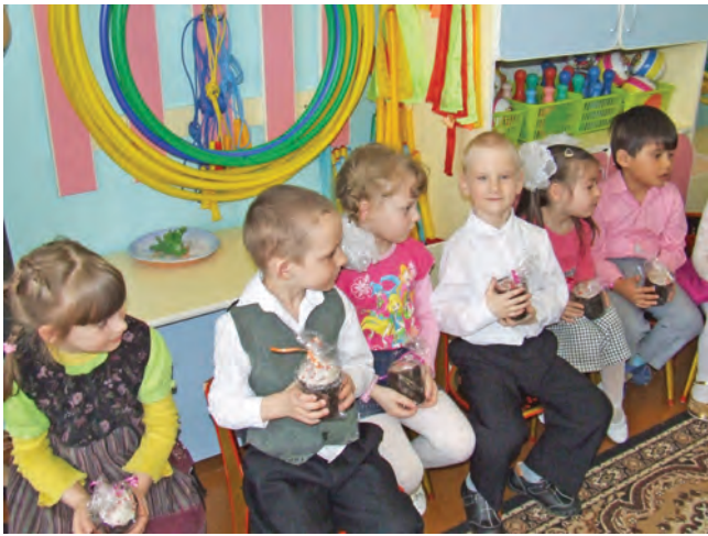
Пасха для детсадовцев.