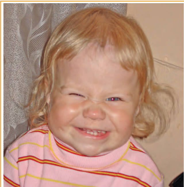
Полосу подготовила Наталья Киселева.

Стульчики следует поставить спинками внутрь. Ребята под музыку ходят вокруг стульев. Как музыка прервется, каждый должен положить на рядом стоящий стул предмет своей одежды: тапочку, бантик, поясок или что-то другое. И так, три раза. После того опять включается музыка, однако теперь ее внезапно прерывает сигнал: "Пожар!" Услышав его, участники игры должны быстро собрать все три своих предмета одежды и надеть их на себя. Кто оделся последним, из игры выбывает.