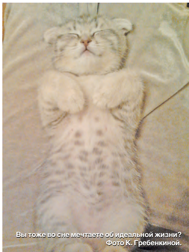
Вы тоже во сне мечтаете об идеальной жизни?