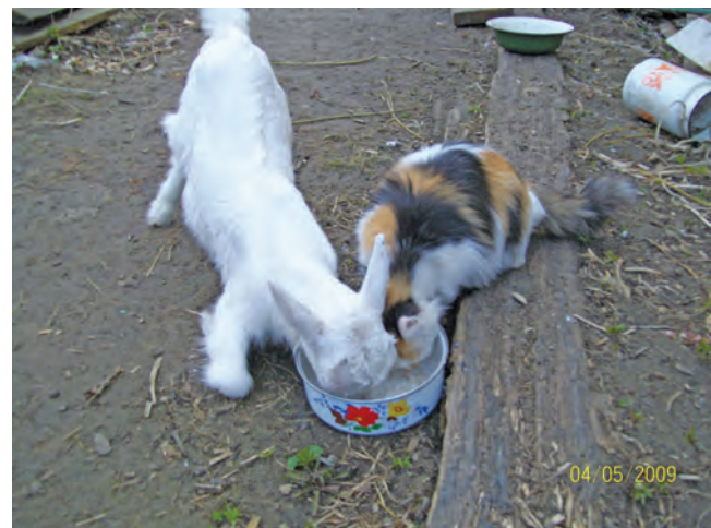
Геркулесовая каша у козленка в плошке. Дома в миске каша та же - на обед для кошки. Но расчет у кошки тонкий - рассуждает здраво: Я сперва начну с козленком кушать на халыгу. А свое - всегда успею. И проверю, дай-ка - Вдруг готовит повкуснее для козла хозяйка?