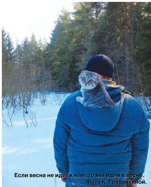
Если весна не идет к нам, то мы идем к весне.