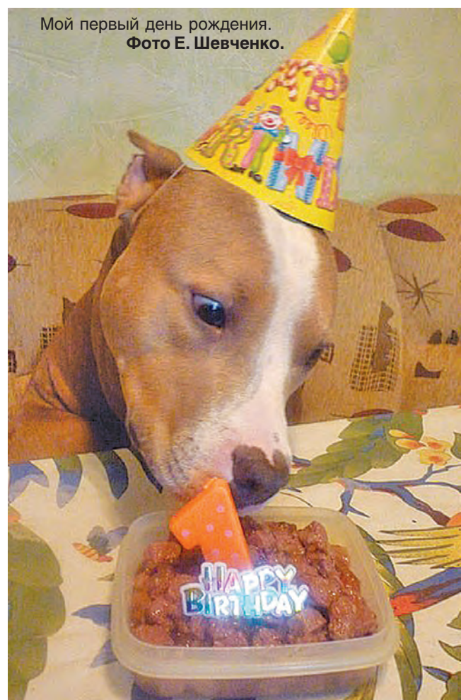
Мой первый день рождения.