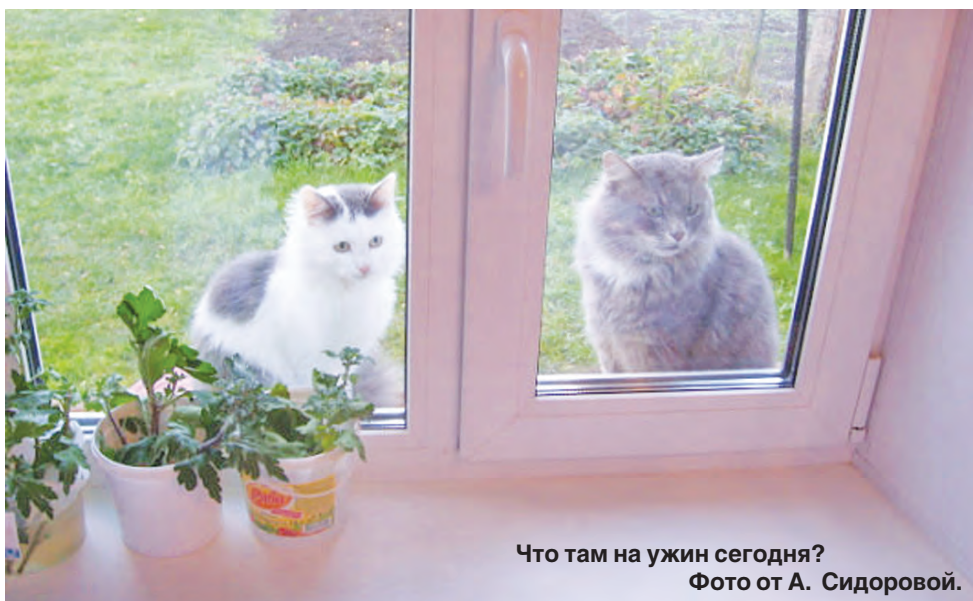
Что там на ужин сегодня?