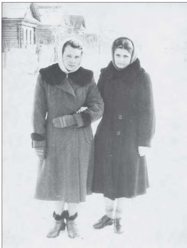
1957 год. Улица Советская в нашем городе была местом гуляния молодежи. Зимних сапог и ботинок в то время не было, а помодничать хотелось. Вот и надевали девчонки капроновые чулки и туфли. Щечки, возможно, при этом и были розовые, а вот ноги...