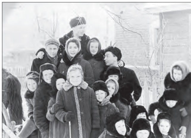
1962 год. Свадьба в деревне - великое событие. Поглазеть на нее собиралась все - от мала до велика.

Времена меняются, но больше всего эти изменения проявляются внешне: люди начинают носить другую одежду, строить иные дома, делать совсем другие прически, есть каждый день то, что еще совсем недавно выставляли лишь на празд-