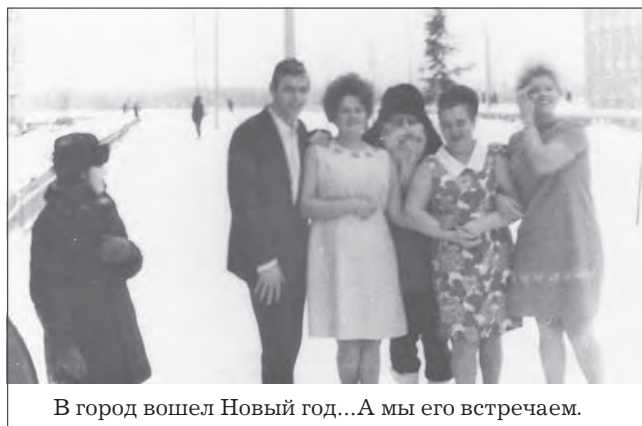
В город вошел Новый год...А мы его встречаем.