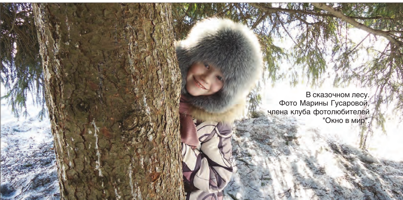
В сказочном лесу.