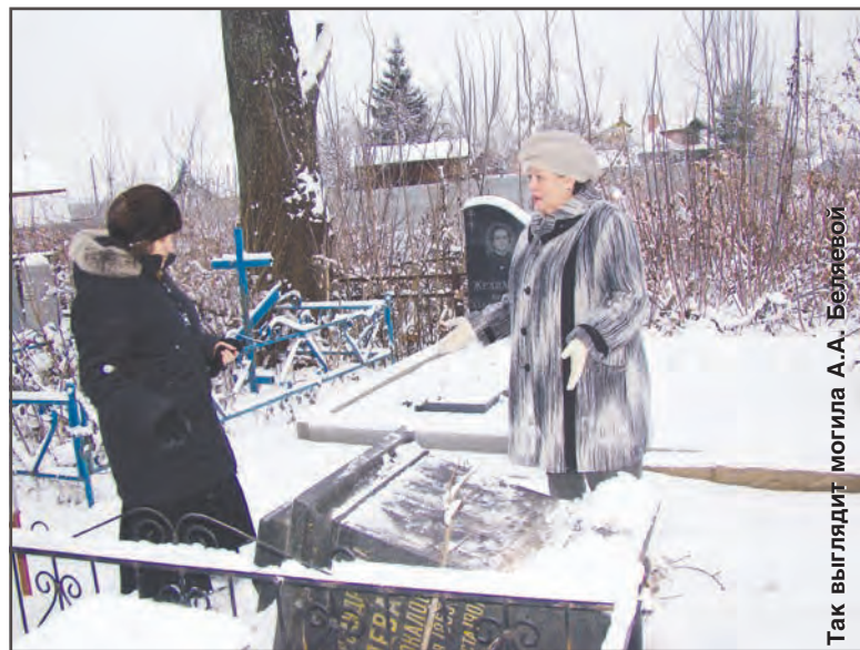
Так выглядел могилы А.А. Беляевой