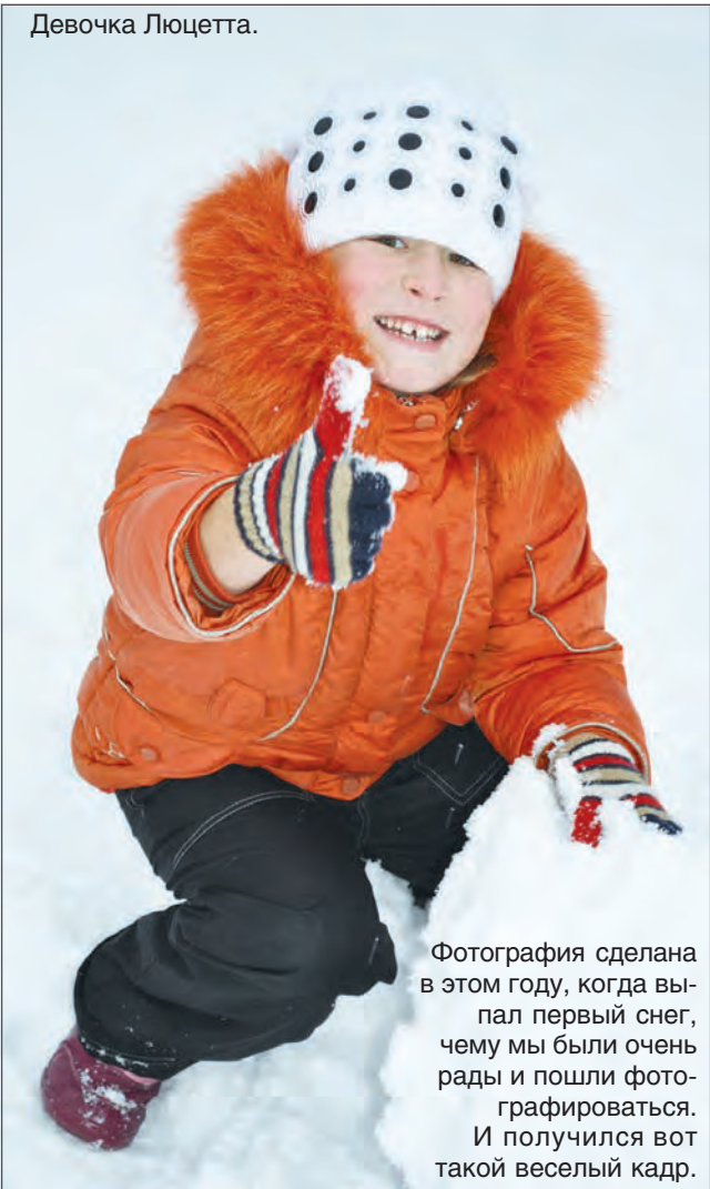
Фотография сделана в этом году, когда выпал первый снег, чему мы были очень рады и пошли фотографироваться. И получился вот такой веселый кадр.