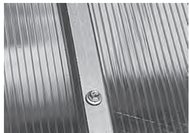
Усиленное крепление: саморез + оцинкованная лента.

Кроме того, в этом осеннем сезоне, мы используем усиленное крепление поликарбоната: оцинкованные ленты + кровельные саморезы , благодаря чему полностью исключается случайное продавливание поликарбоната при монтаже, а также прорыв поликарбоната шляпкой самореза при сильном ветре.