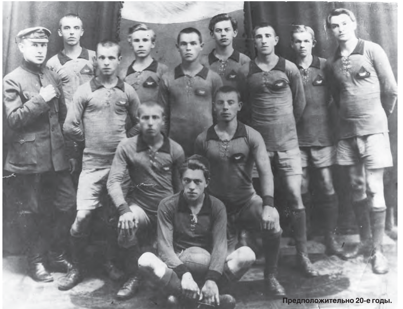
Предположительно 20-е годы.