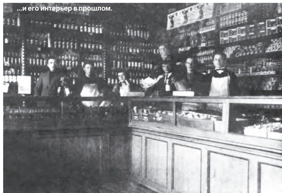
...и его интерьер в прошлом.