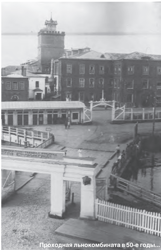
Проходная льнокомбината в 50-е годы...