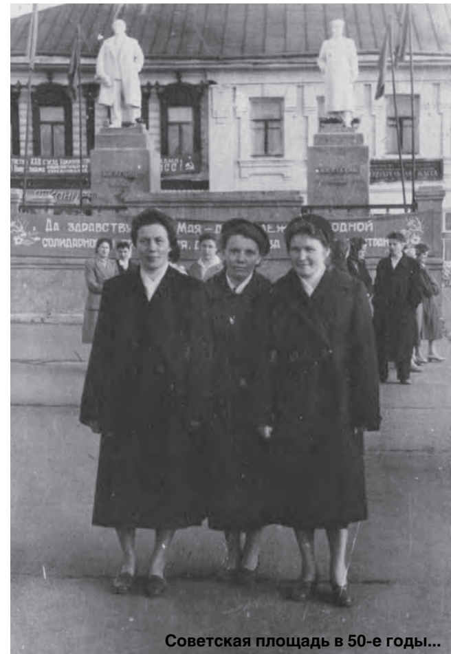
Советская площадь в 50-е годы...

коллеги по коммунистической партии продержалась на Советской площади почти на двадцать лет дольше, и возле нее вплоть до середины 70-х торжественно принимали в пионеры мальчишек и девочек второй школы.