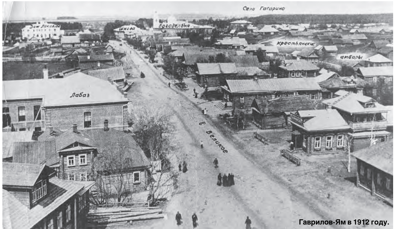
Гаврилов-Ям в 1912 году.

Нынче Гаврилов-Ям отмечает свой 74-й день рождения в статусе города. И за эти семь десятков лет его облик здорово изменился: исчезли маленькие деревянные дома, на их месте построены новые - красивые, многоэтажные, удобные. Появились целые жилые микрорайоны, а в них - школы, детские сады, уютные зоны отдыха. В общем, от старого Гаврилов-Яма сегодня не осталось практически ничего - разве только фотографии, да и тех, к сожалению, немного. Но на каждой - живая история, к которой мы с вами и попытаемся сейчас прикоснуться. А помогут нам в этом сотрудники краеведческого отдела-музея Центральной межпоселенческой библиотеки - главные хранители и затоки прошлого родного края.