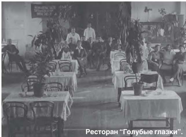
Ресторан "Голубые глазки".