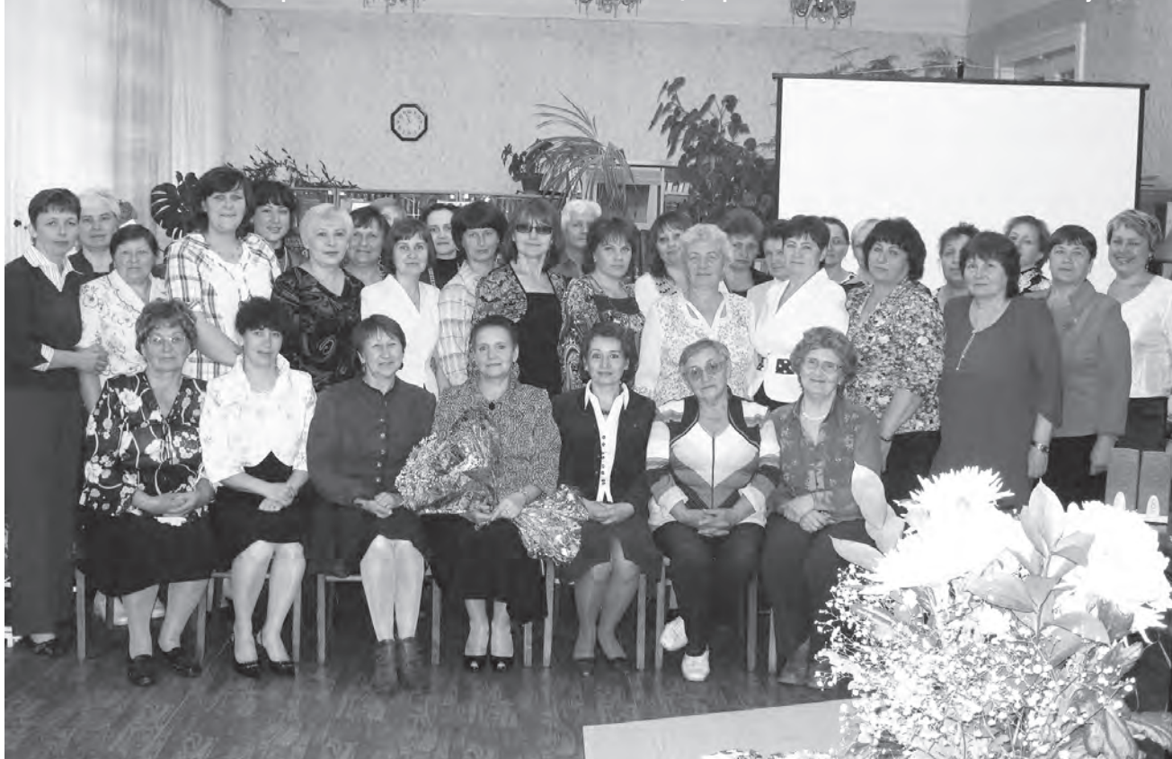
Коллектив МБУК "Гаврилов-Ямская межпоселенческая центральная районная библиотека-музей"

Ответы на вопросы викторины вы можете предоставить в читальный зал центральной районной библиотеки-музея. Победителей ждут призы.