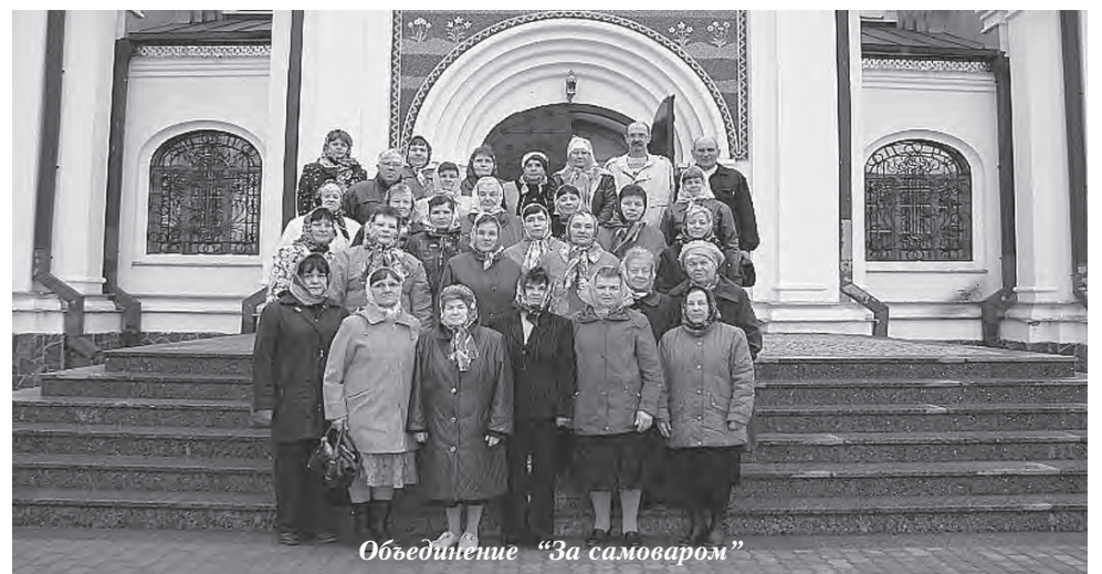
Объединение "За самоваром"