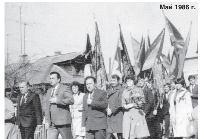
Май 1986 г.

были как не было, так и нет. Ежегодно созывается собрание акционеров, чтобы на нем объявить: прибыли нет, и не ожидается, а сертификаты уже не в моде. Если собирают акционеров, то выходит не совсем частное предприятие. Почему половину ткацкого производства и швейный участок называются льнокомбинатом? Ведь ни одного метра льняной ткани не выпускается, ни одного килограмма пряжи не вырабатывается, хотя продукция, оставшаяся на складах со времен работы льнокомбината до сих пор используется? Меня как акци-