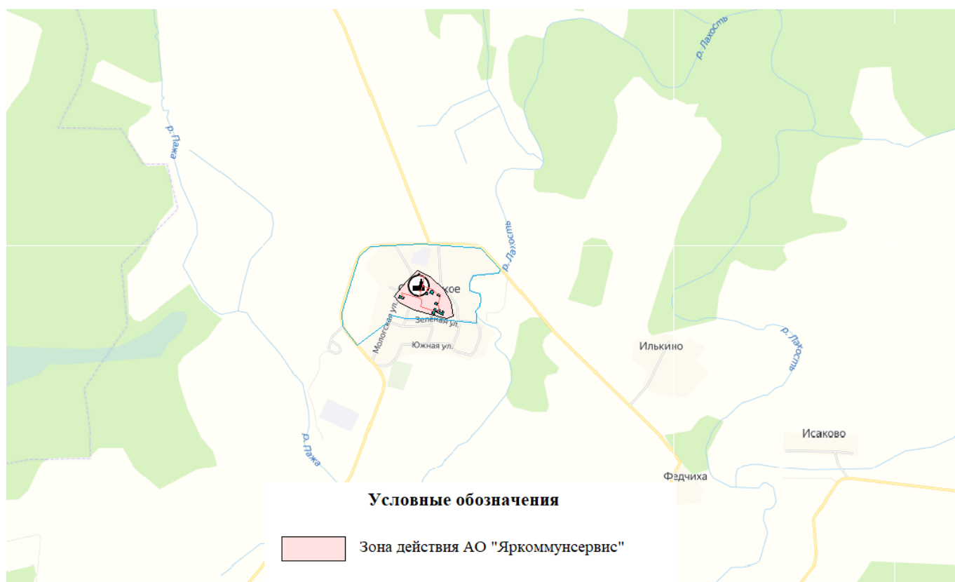
Присоединенная нагрузка в зоне действия источника